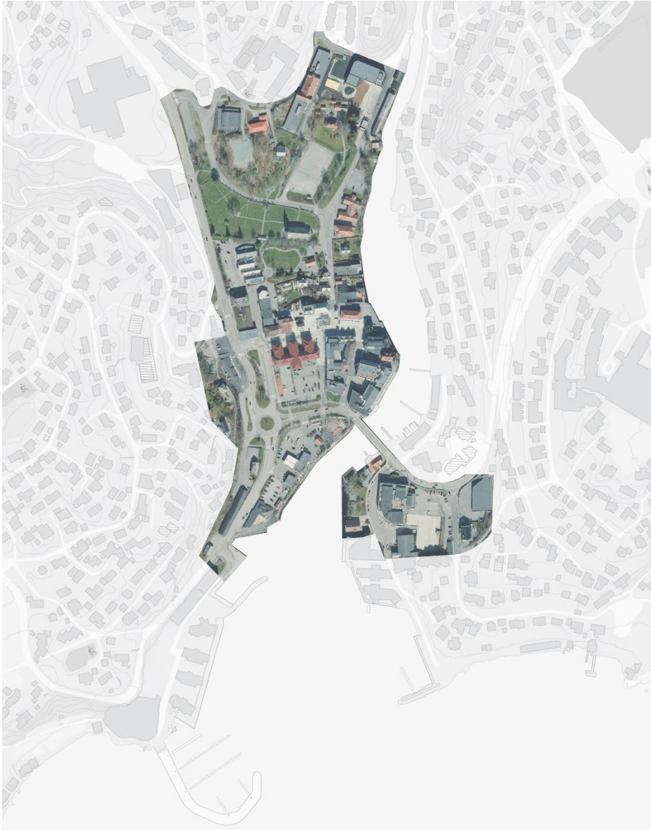
Figur 2: Planområdet med dagens Osøyro

Ein kan sjå kart over planområdet i figur 2. På figur 3 kan ein sjå same avgrensing med områdeplan for Osøyro.