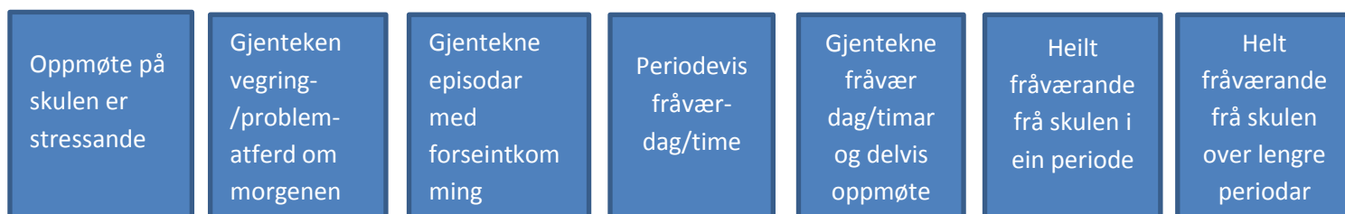
Kontinuum av skulevegringsåtferd (Kearney, 2008)

I arbeid med skulefråvær skil ein ofte mellom meir emosjonelt betinga fråvær («skulenekt-skulevegring») og antisosial atferd, «skulk». (Thambirajah, Grandison & De-Hayes, 2008). Kearney (2002) definerer «school refusal behavior» slik: Elevmotivert vegring mot å møte på skulen eller vanskar med å vere tilstade i klassen/på skulen heile skuledagen (sjå illustrasjon). omegrepa inkluderer alle elevar som vegrar seg for å gå på skulen, med og utan angstrelatert åtferd (og/el depresjon).